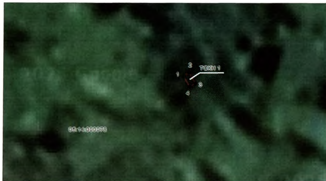
Система координат: МСК-05