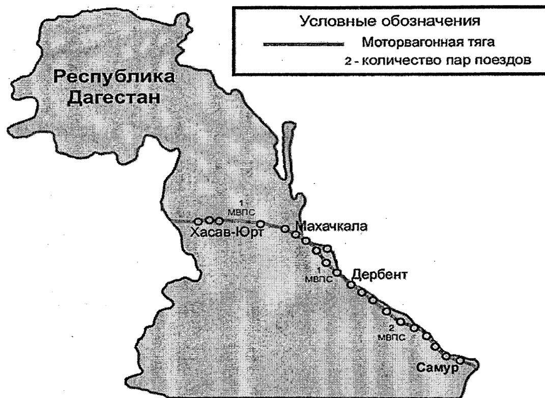
Рисунок 1. Схема транспортного обслуживания Республики Дагестан в части пригородных железнодорожных перевозок.