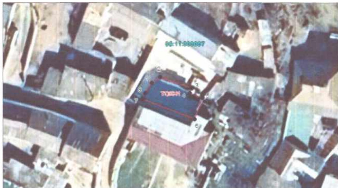
Система координат: МСК-05, зона I