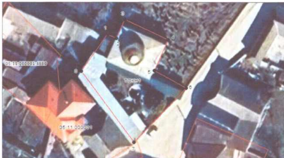
Система координат: МСК-05, зона 1.