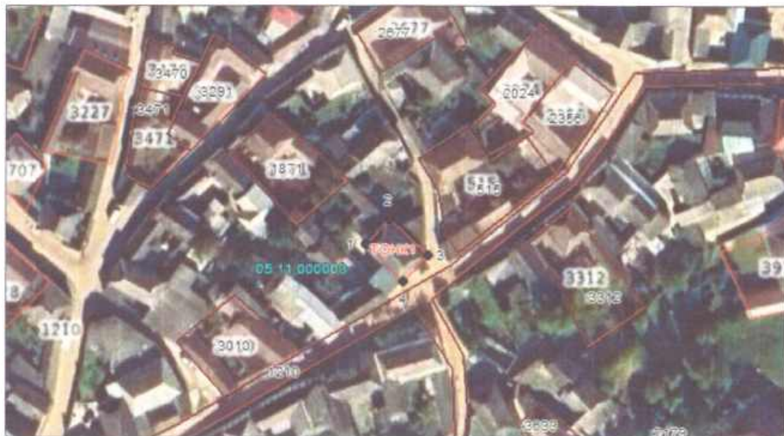
Система координат: МСК-05, зона I