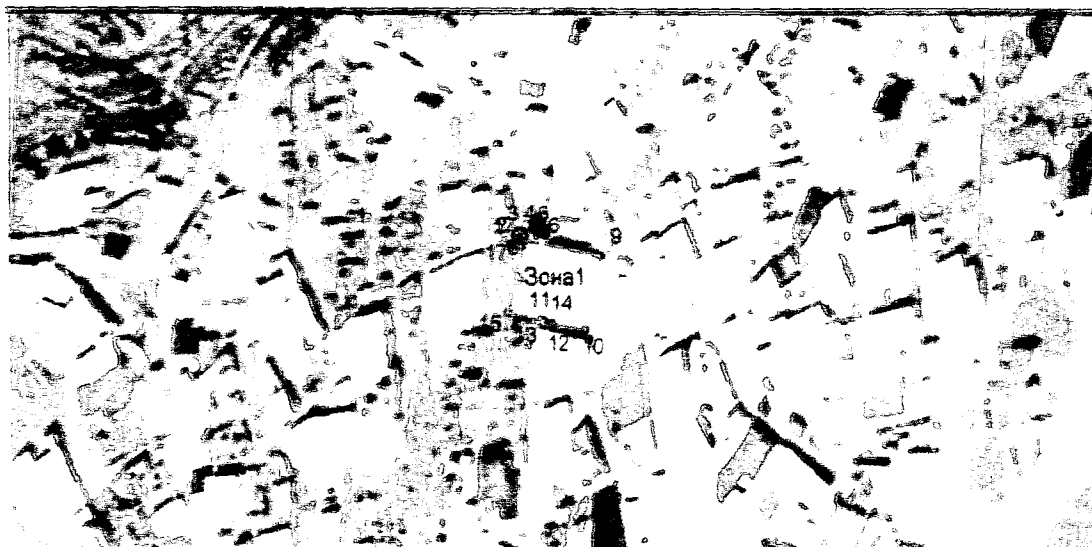
Каталог координат поворотных точек, длин, углов